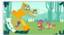
Секретное снабдьё 3 серия