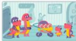
Кто что будет? 4 серия