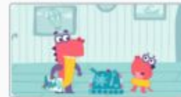
Генератор чуда 6 серия