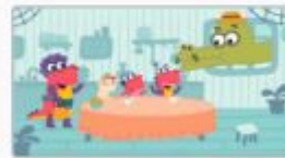
Ириски 2 серия