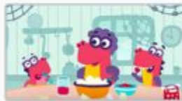
Юбилей 1 серия

Главные герои мультсериала Учи.ру — заврик Гриша и его сестра Соня — в каждой серии сталкиваются с необычными задачами, но легко преодолевают их благодаря отличным знаниям из школьной программы. Приятного просмотра!