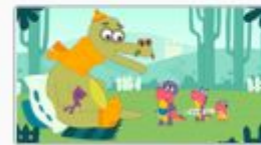
Секретное снадобье 3 серия