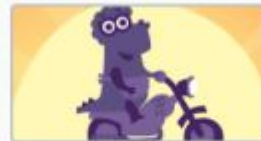
Стороны света 5 серия