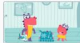
Генератор чуда 6 серия