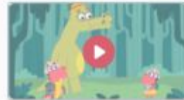
Люминарики 7 серия