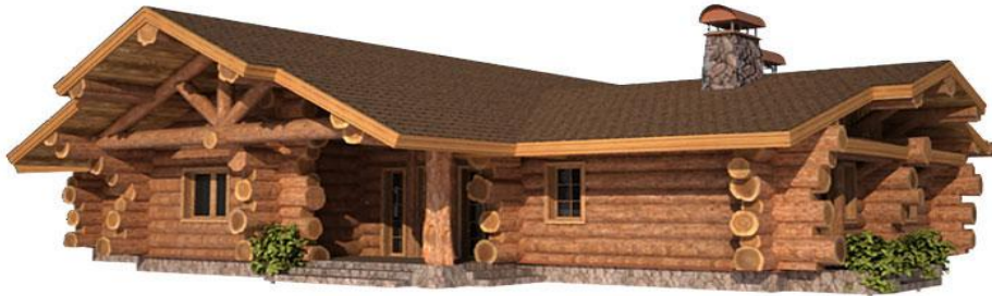
1:10 - 10 ЕП