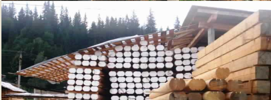
Строительство деревянных коттеджей Construction of wooden cottages