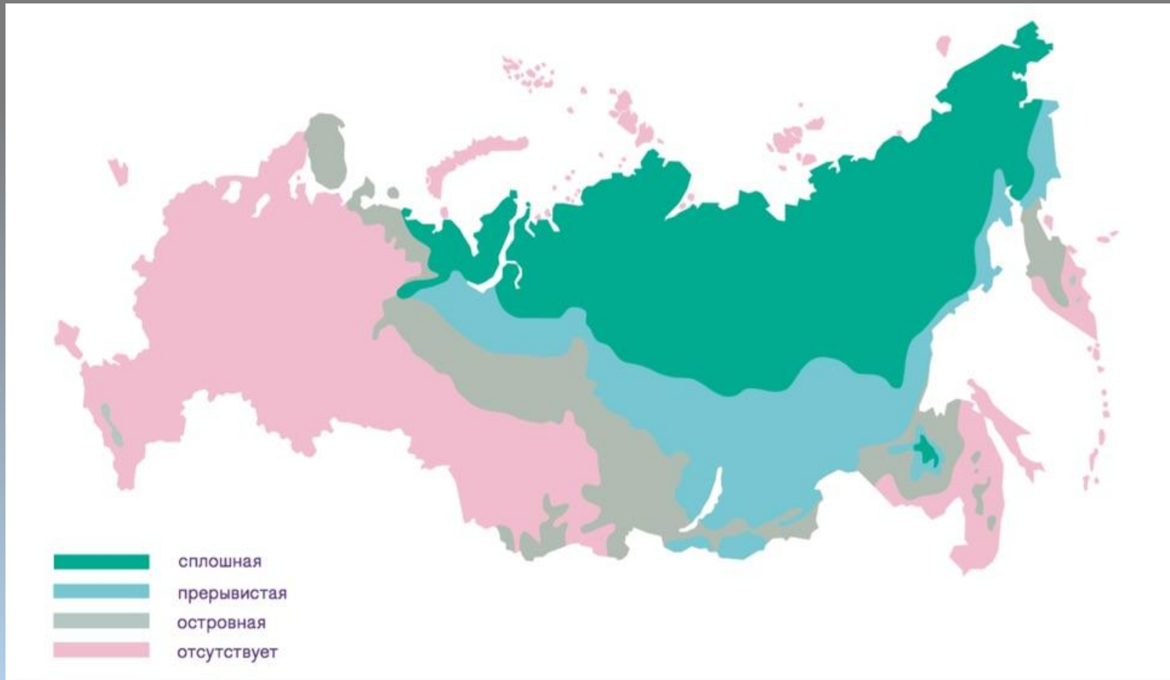
Рисунок 1 – Распространенность многолетней мерзлоты на территории РФ