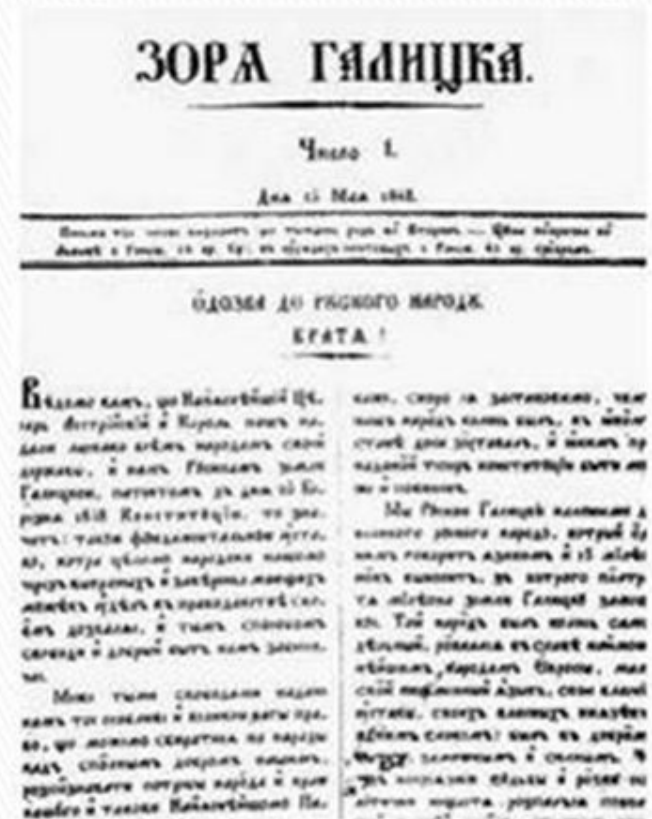
Фрагмент першої сторінки першого числа газети. 15 травня 1848 р.

У відозві до українського народу, опублікованій у першому номері газети, Рада заявила: «Ми, русини галицькі, належимо до великого руського народу, який розмовляє однією мовою...» То була перша в Галичині офіційна заява про те, що наддніпрянські й галицькі українці - одна нація.