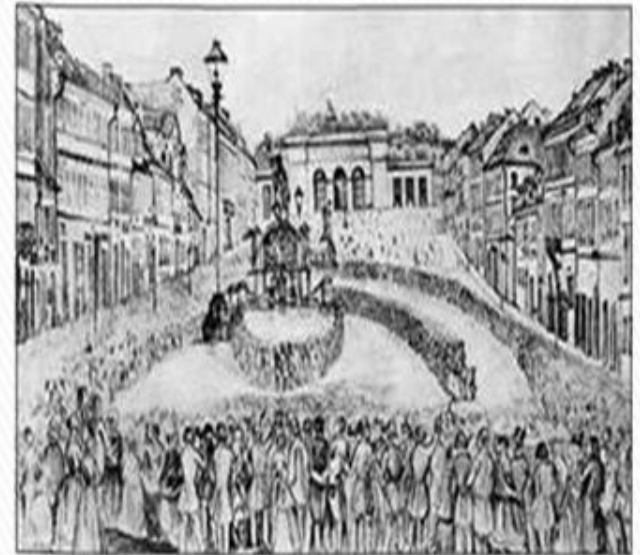
Слов'янський з'їзд у Празі в червні 1848 р.