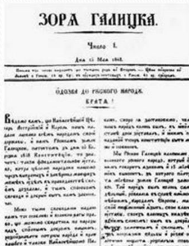
Фрагмент першої сторінки першого числа газети. 15 травня 1848 р.

У відозві до українського народу, опублікованій у першому номері газети, Рада заявила: «Ми, русини галицькі, належимо до великого руського народу, який розмовляє однією мовою...» То була перша в Галичині офіційна заява про те, що наддніпрянські й галицькі українці - одна нація.