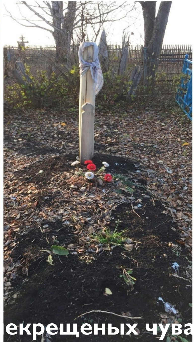
Кладбище некрещеных чуваш