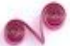
завиток в форме V