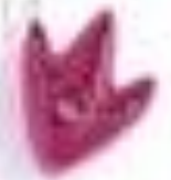
утиная лапка (плечья лапка)