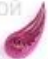
изогнутая капля (крыло, лепесток)