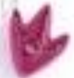
утиная лапка (плечья лапка)