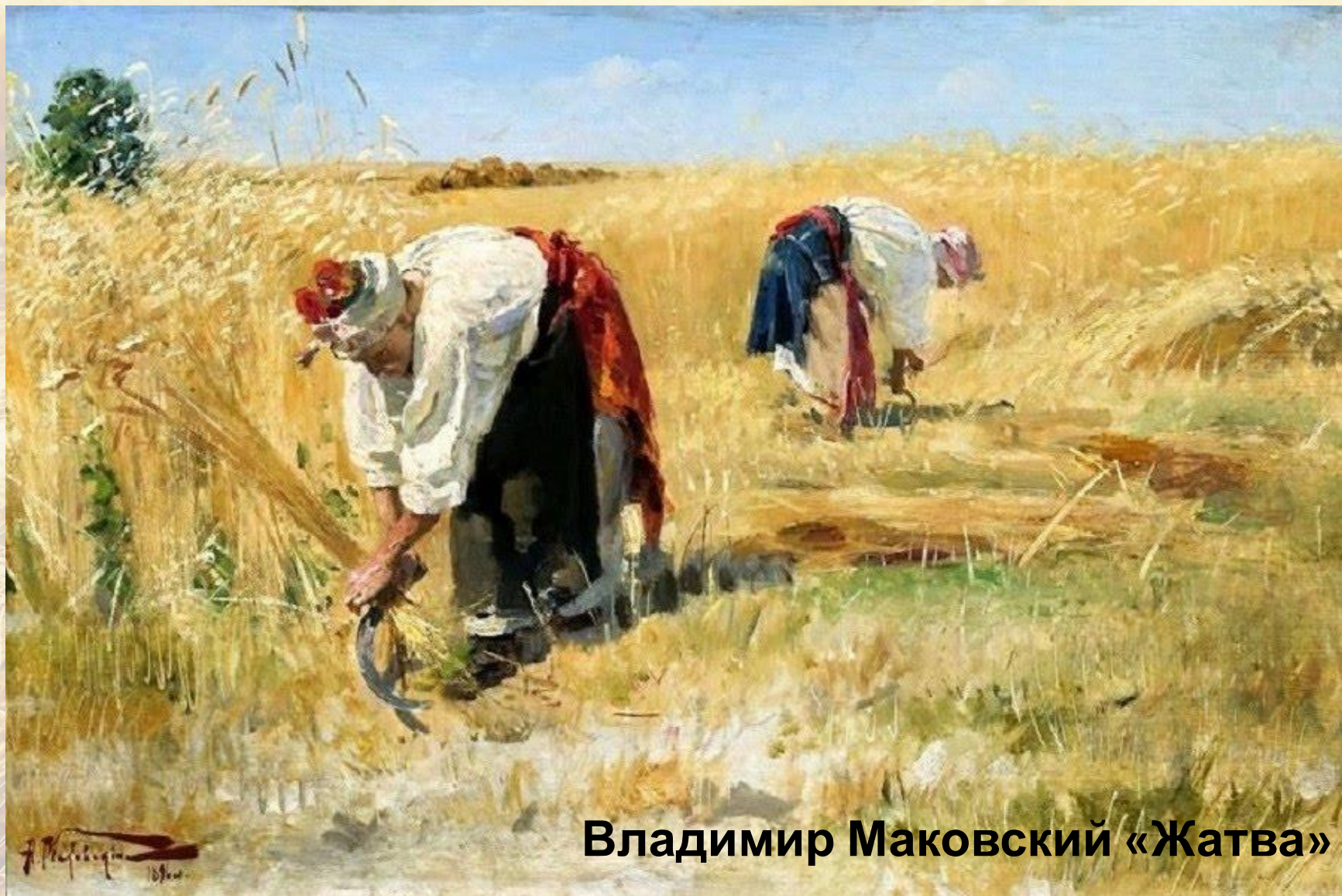
Владимир Маковский «Жатва»