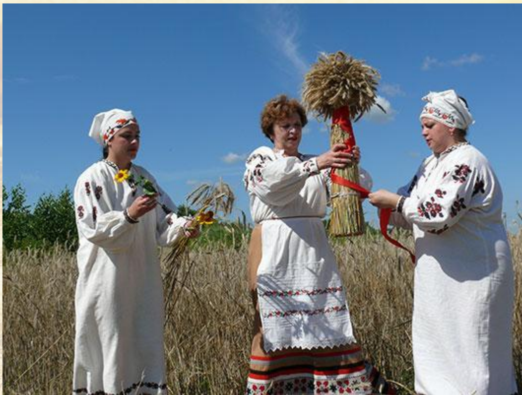
Сноп из трубочек