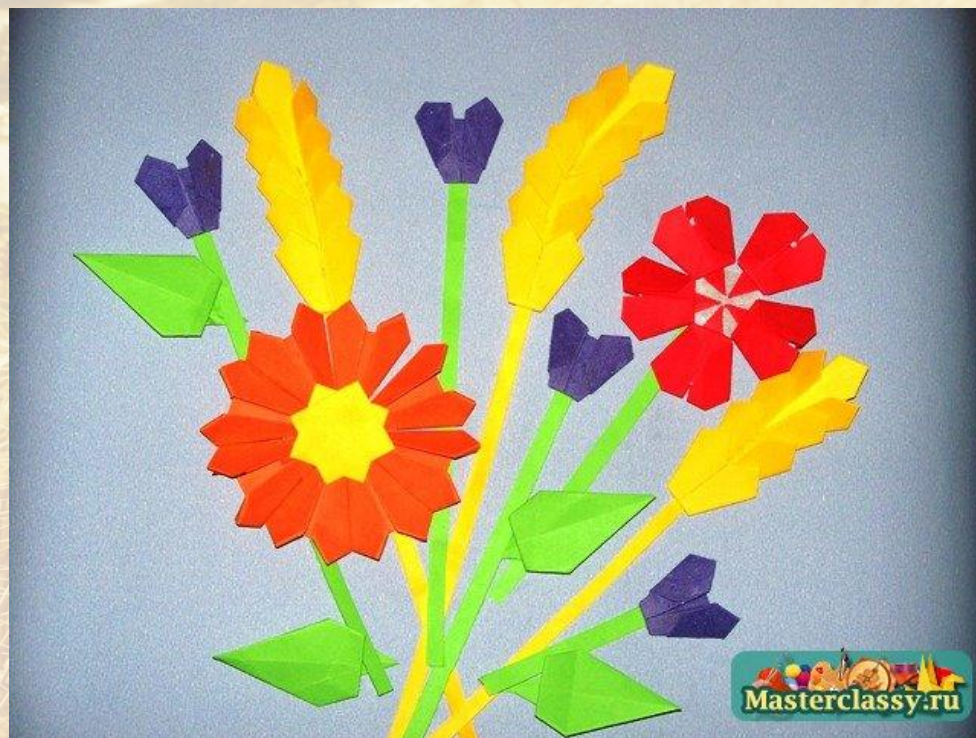
Модульное оригами Мастеркласс