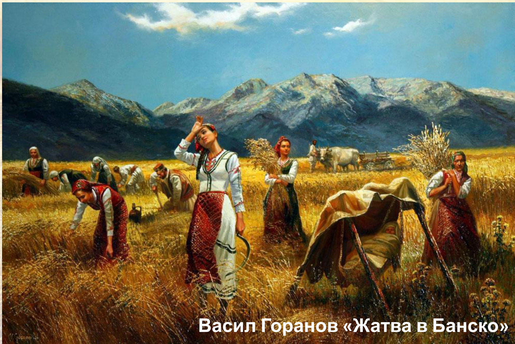
Васил Горанов «Жатва в Банско»