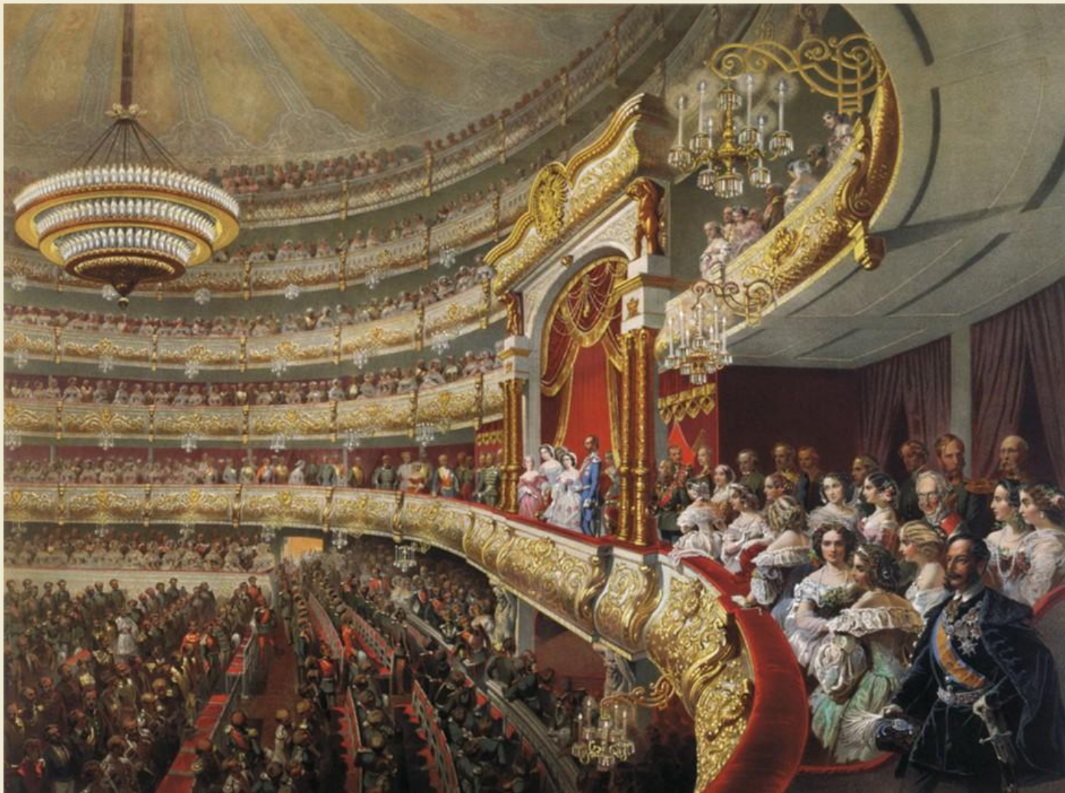
Театр ~19 века изнутри