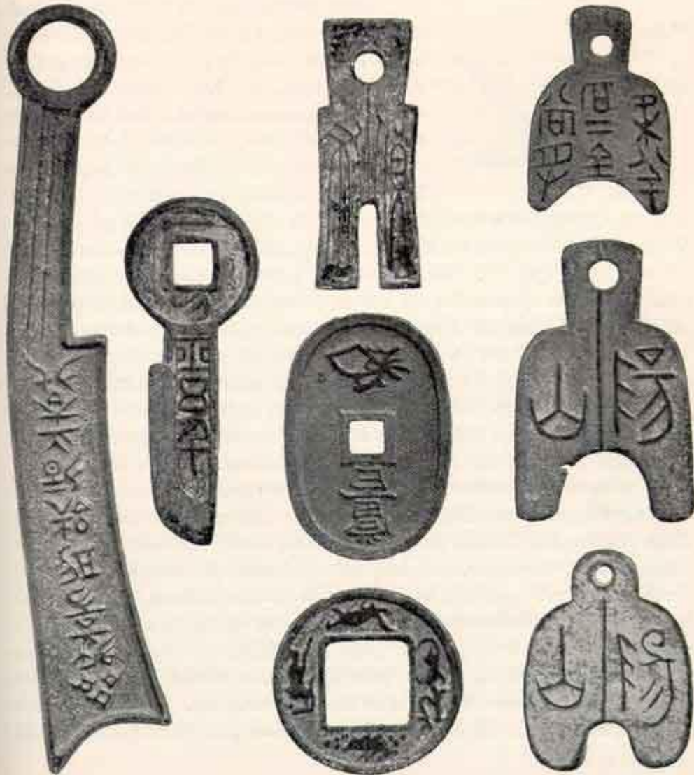
Chinesische Münzen von 2000 bis 4000 Jahren Alter.

Династия Шан – наследница Ся, Также известна как бронзовая династия. Бронза использовалась для Изготовления сосудов, изделий и оружия. Люди развивали эту технологию и формы, а также знание основ металлургии.