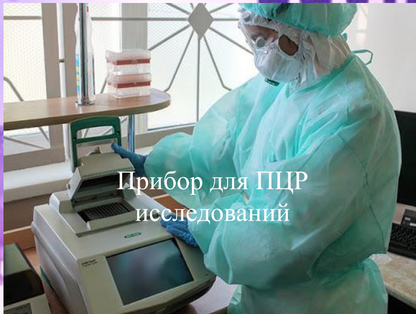
Прибор для ПЦР исследований