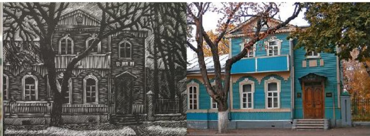
Дом-музей Н.С.Лескова в Орле