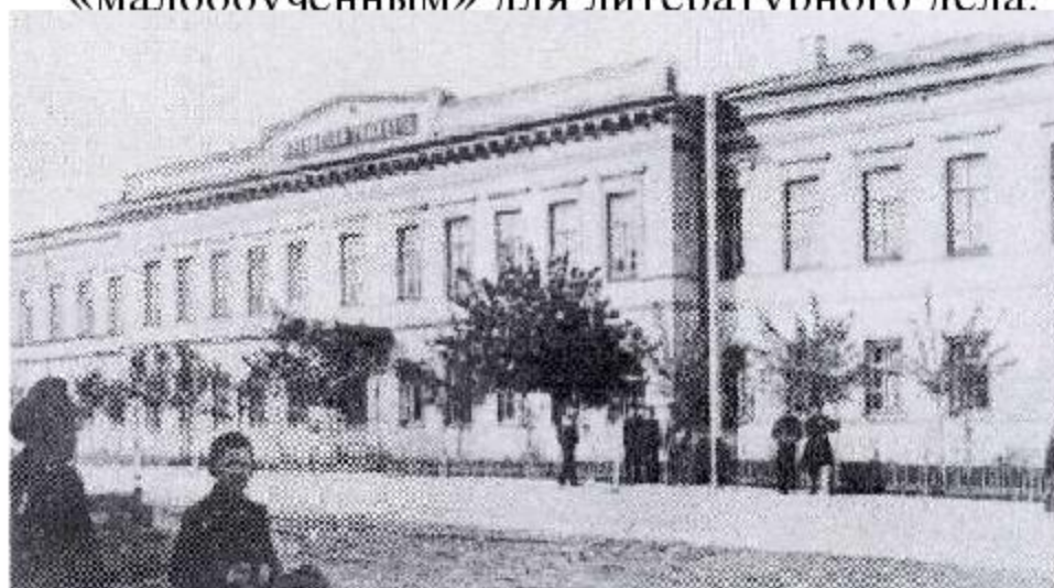
Орловская мужская гимназия

«В науках далеко не зашёлся», – скажет о себе Лесков и назовёт себя «малообученным» для литературного лела.