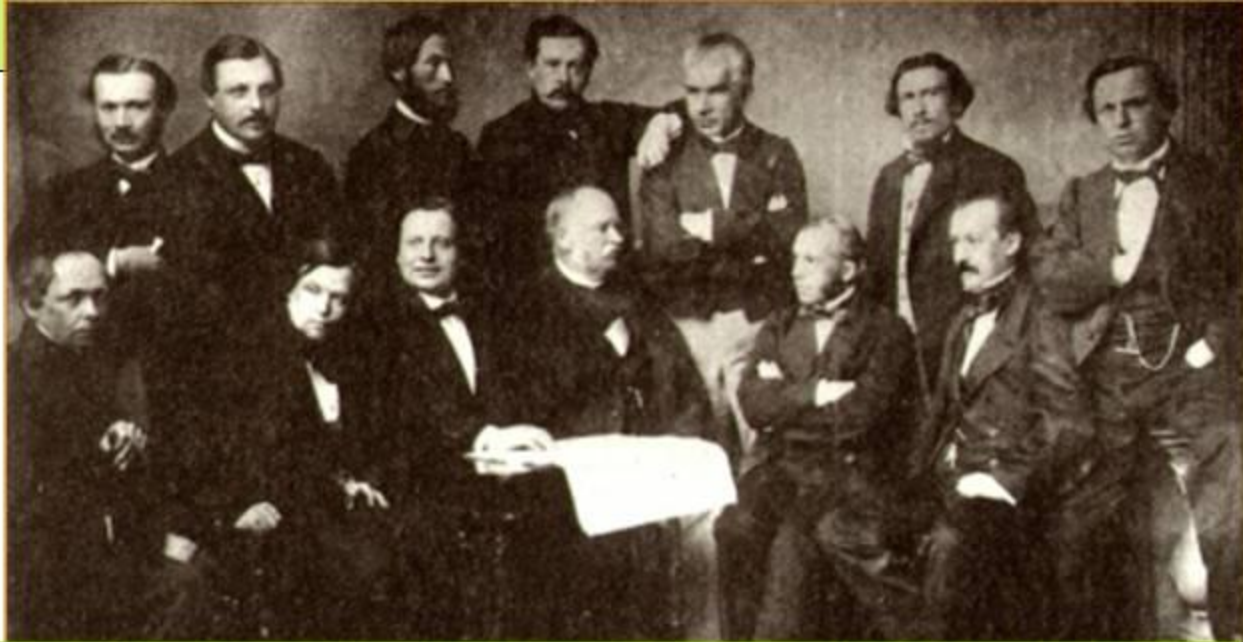
Н.С. Лесков (стоит второй справа) среди сотрудников газеты «Северная пчела». Фото начала 1860-х

С начала 1862 года Н. С. Лесков стал постоянным сотрудником газеты «Северная пчела», где начал писать как передовые статьи, так и очерки, нередко на бытовые, этнографические темы, но также — критические статьи. Высокую оценку его деятельность, получила на страницах тогдашнего «Современника».