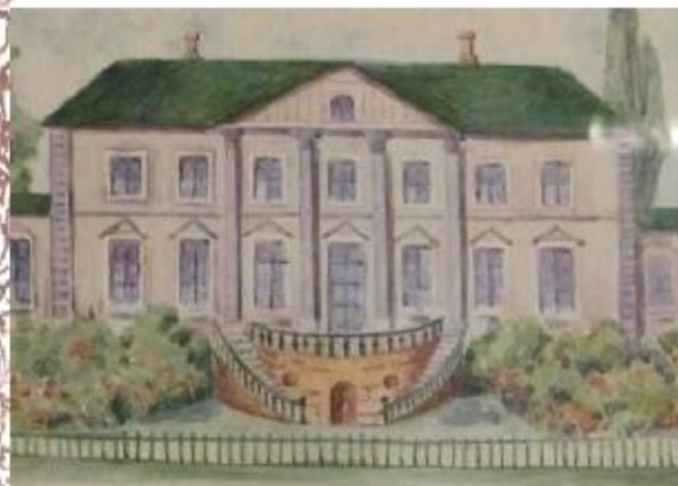
Дом в селе Горохово, где родился Н.С.Лесков

«Наш дом был в Орле на Третьей Дворянской улице и стоял третий по счёту от берегового обрыва над рекою Орликом. Место довольно красиво», – вспоминал Николай Семёнович Лесков.