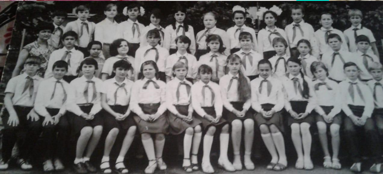
Пионерский патруль "Салют" 99 залес. и. Уфа