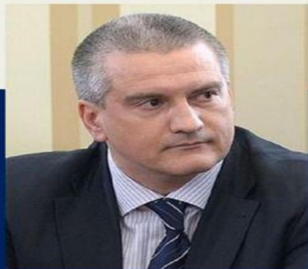
Сергей Валерьевич Аксёнов Глава Республики Крым с 9 октября 2014 года.

Председатель Совета министров Республики Крым с 17 марта 2014 года