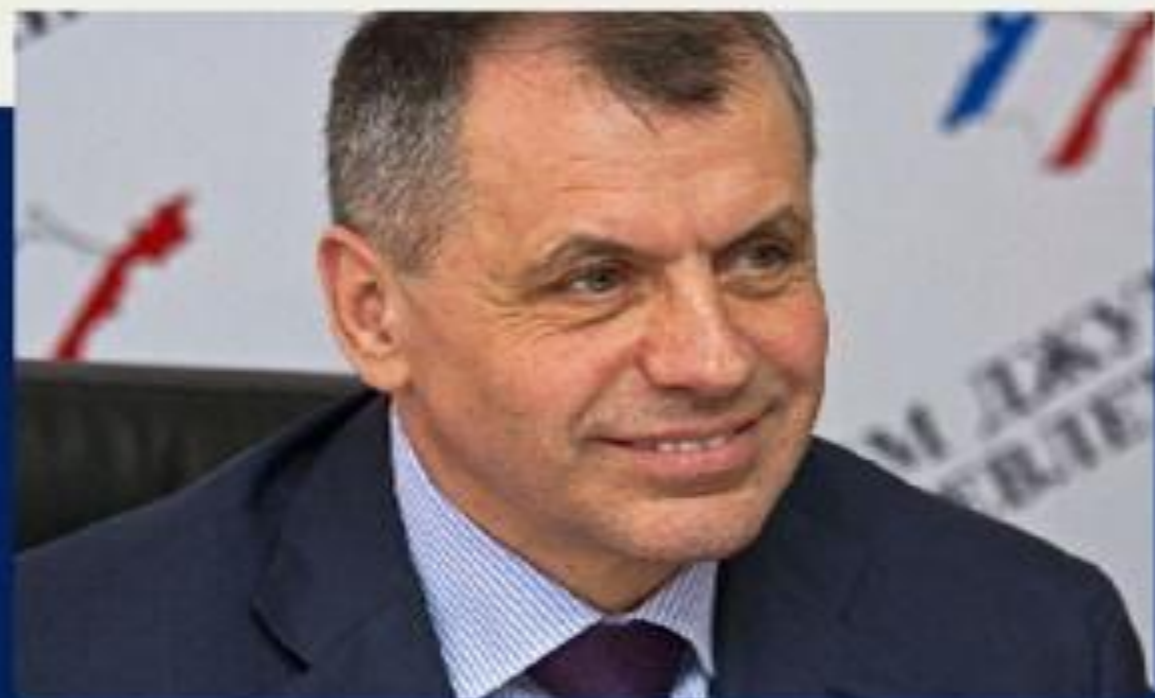
Константинов Владимир Андреевич

Председатель Совета министров Республики Крым с 17 марта 2014 года