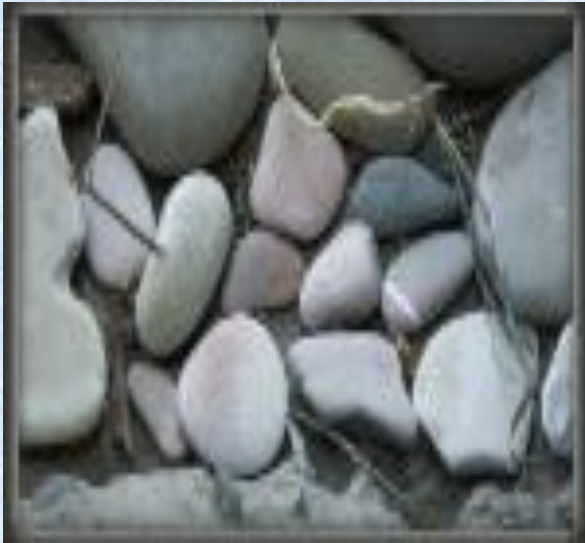
«Мальчик с пальчик»