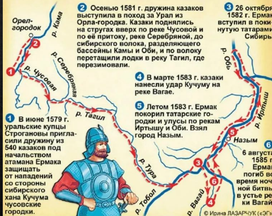
Схема похода в Сибирь дружины Ермака

До сих пор нет достоверной информации о хронологии событий похода и их взаимосвязи. Сибирские летописи отрывочны, путаются в годах и не содержат сведений о месяцах и датах. Но сами факты произошедших сражений сомнений у историков не