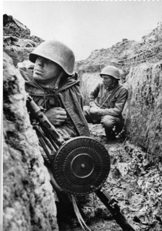
Советские воины готовятся к атаке.

Войска Ленинградского и Волховского фронтов 18 января 1943 года прорвали блокаду Ленинграда. Хотя достигнутый военный успех был достаточно скромным (ширина коридора, связавшего город со страной, была всего 8 — 11 километров ), политическое, материально-экономическое и символическое значение прорыва блокады невозможно переоценить. В кратчайшие сроки были построены железнодорожная линия Поляны — Шлиссельбург , автомобильная магистраль и несколько мостов через Неву , 7 февраля на Финляндский вокзал прибыл первый поезд с «большой земли». Уже с середины февраля в Ленинграде начали действовать нормы продовольственного снабжения, установленные для других промышленных центров страны. Все это коренным образом улучшило положение жителей города и войск Ленинградского фронта.