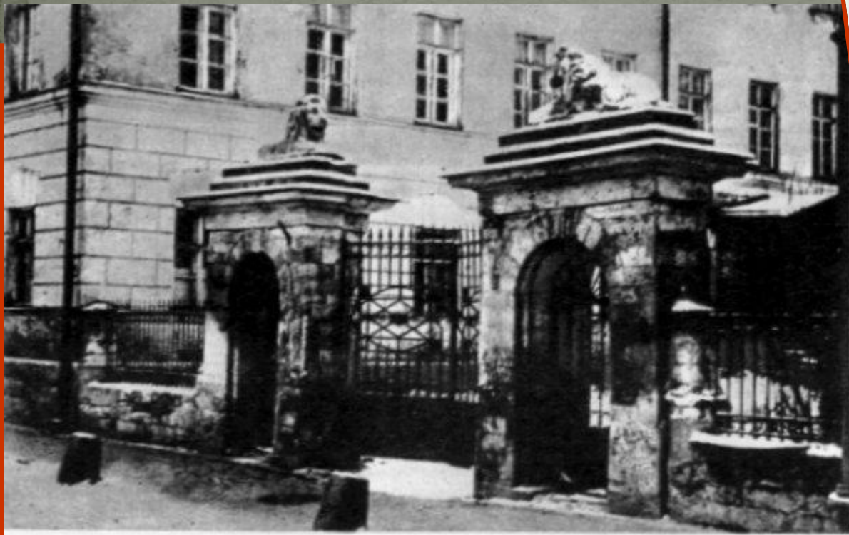
Московская Мариинская больница для бедных на ул. Божедомке (ныне улица Достоевского). Здесь родился Ф. М. Достоевский. В левом флигеле больницы находилась квартира родителей писателя. Фотография.