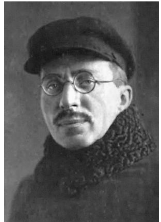
Антон Семёнович Макаренко

«... в нем формируется самостоятельность, ответственность, самоорганизация, целенаправленность их поведения. Дети, которые умеют трудиться, знают цену трудовых усилий, уважают и труд других людей, скорее обратят внимание на человека, который нуждается в помощи.»