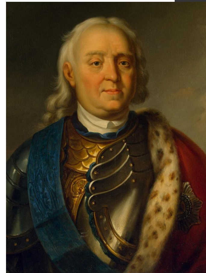
Фёдор Матвеевич Апраксин 15 декабря 1717 — 10 ноября 1728