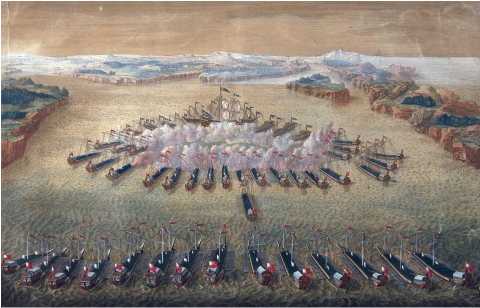
Художественное изображение сражения.