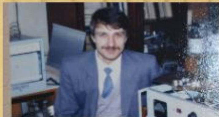
За подготовкой будущей дипломной работы, 1993 год