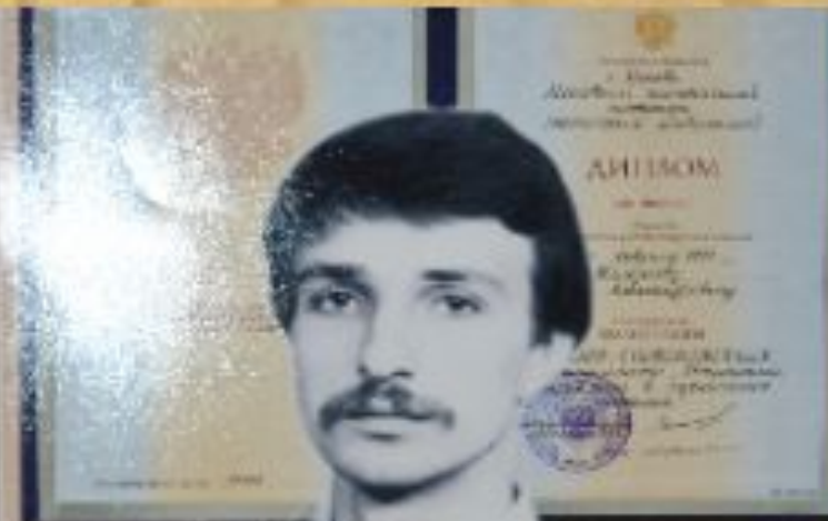
СТУДЕНТ СФМЭИ 1991 - 1997 г.