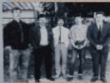
Встреча с друзьями-столовцами, 1990 год