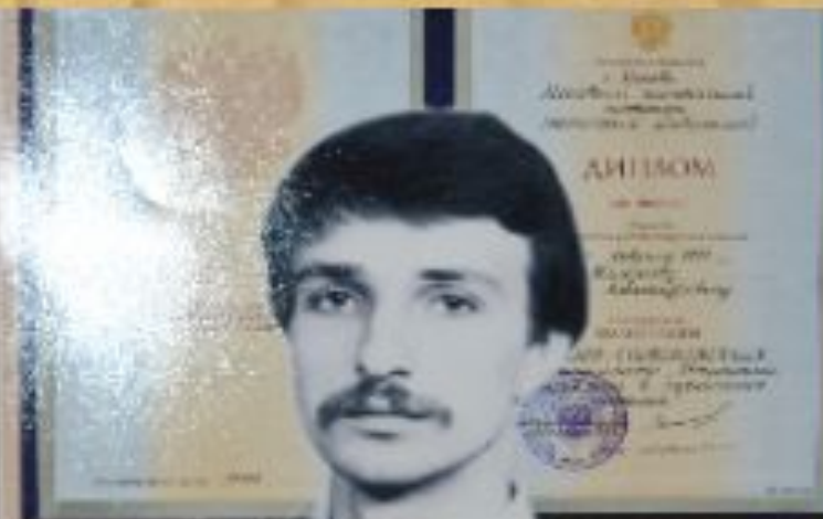
СТУДЕНТ СФМЭИ 1991 - 1997 г.