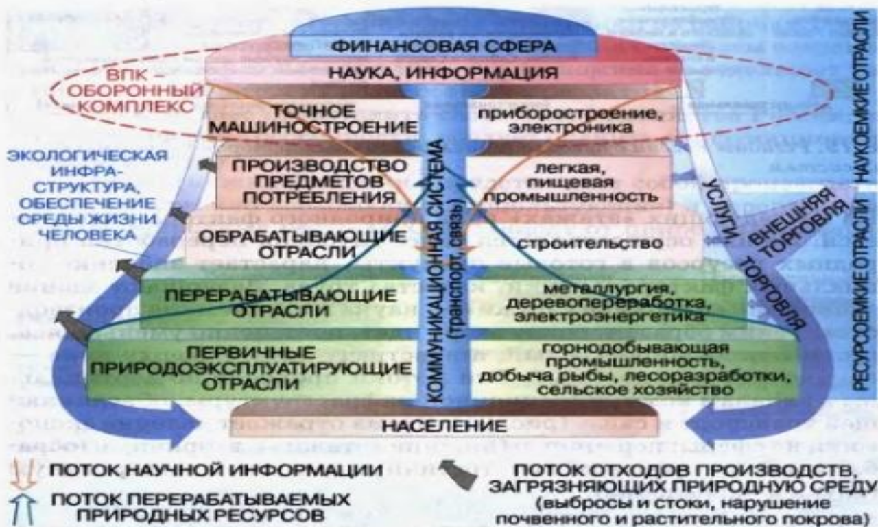
Рис. 21. Функциональная структура экономики России