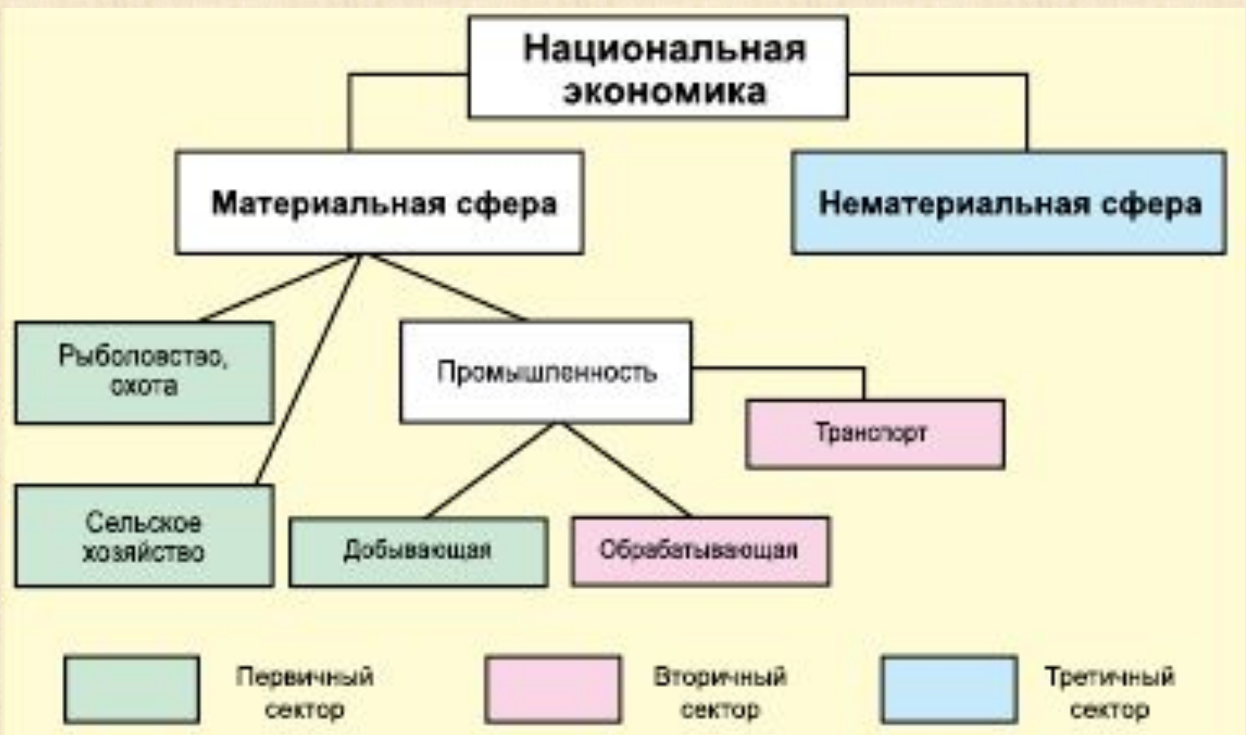
Рис. 47. Сферы и сектора национальной экономики