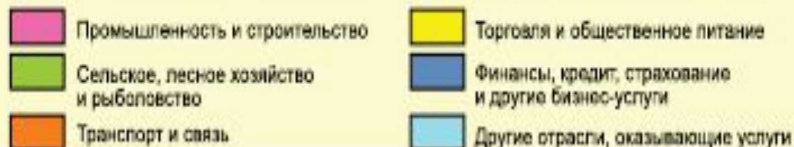
Рис. 46. Доля занятых в отраслях национальной экономики