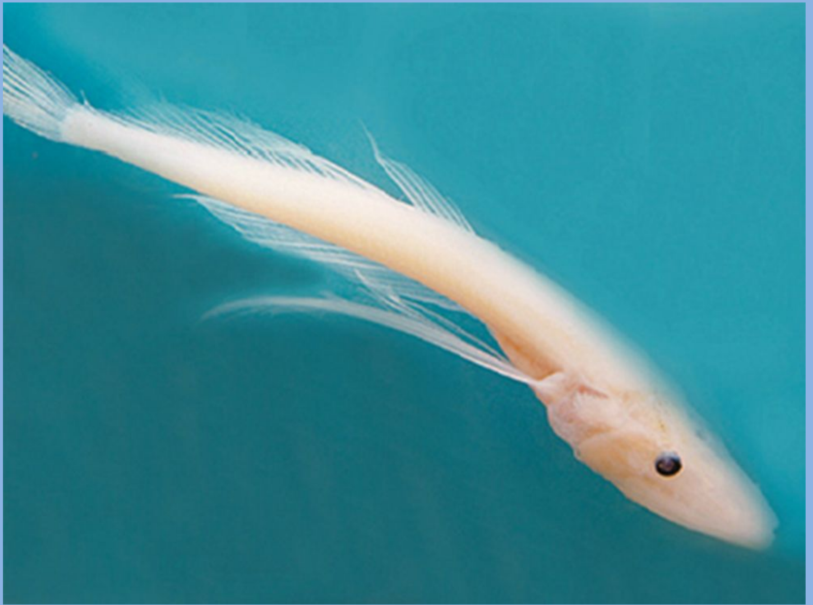
Байкальская рыба голомянка