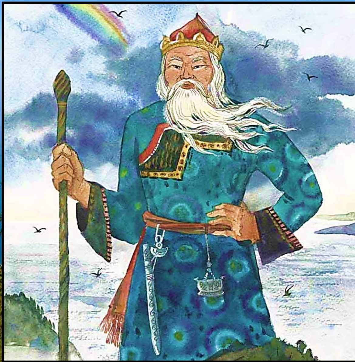
Старик Байкал из сказки-легенды «Ангарские бусы»