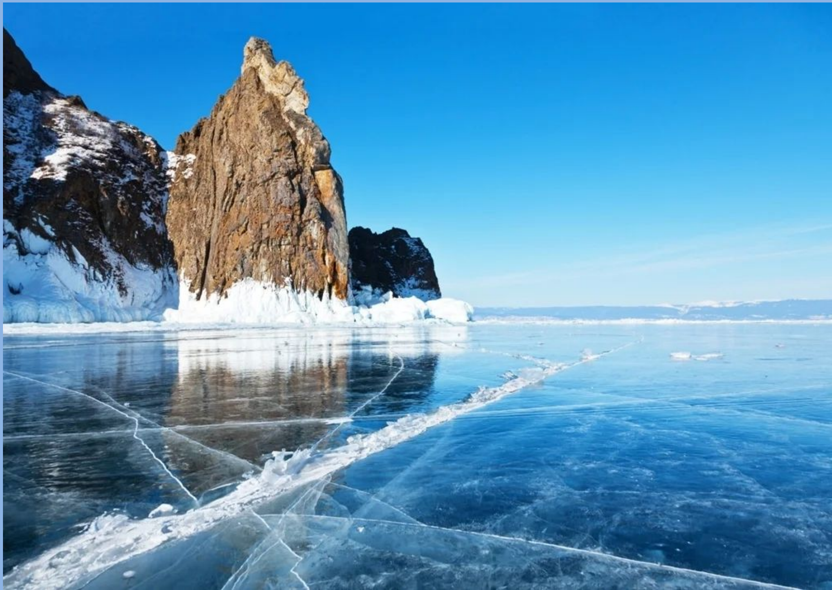
Зимние узоры Байкала