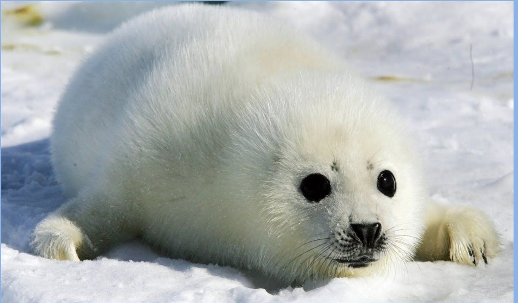
Белек –детеныш нерпы