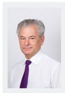
БУЛАЕВ Николай Иванович

Председатель Центральной избирательной комиссии Российской Федерации