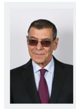
ЭБЗЕЕВ Борис Сафарович

член Центральной избирательной комиссии Российской Федерации