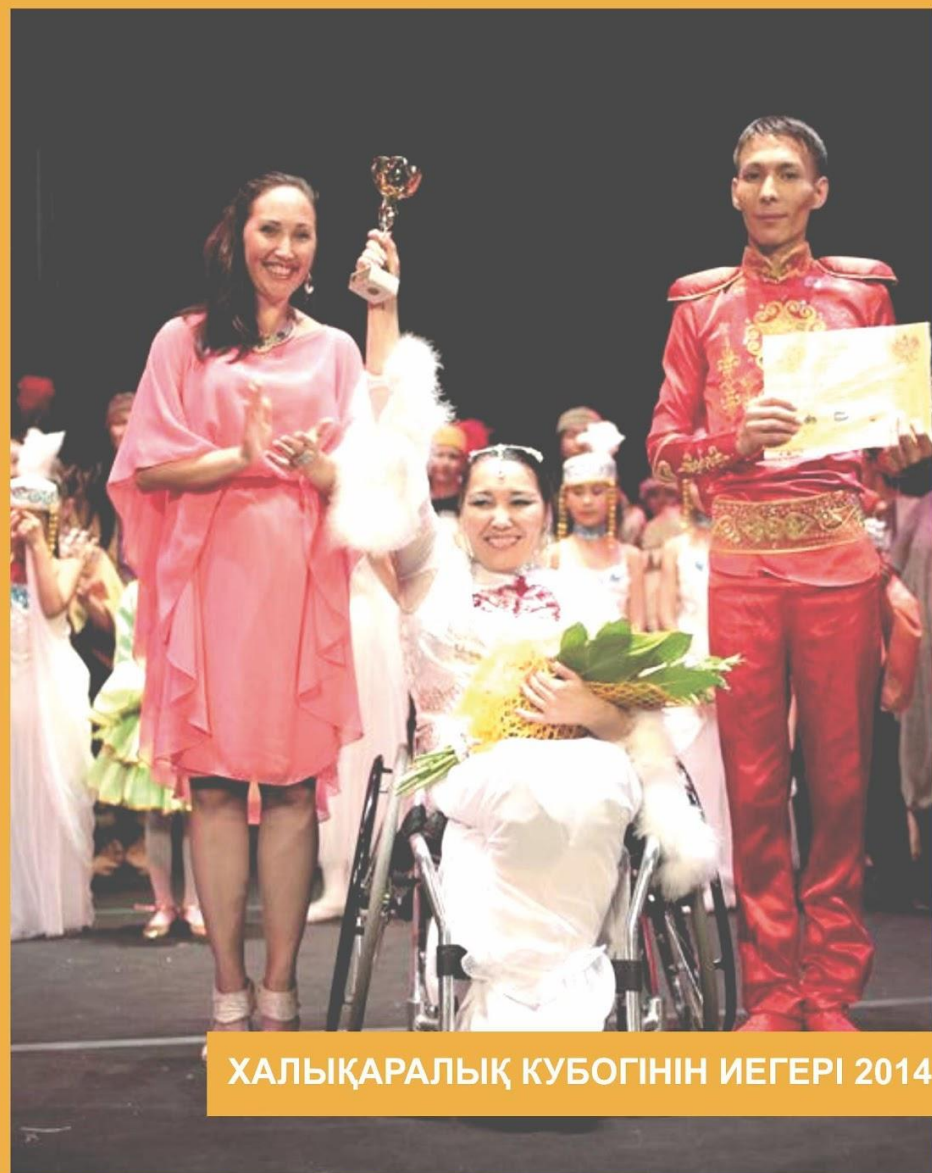
ХАЛЫҚАРАЛЫҚ КУБОГІНІН ИЕГЕРІ 2014

Мүгедектерді сауықтыру және Қазақстан халқының этникалық мәдениетін халықаралық деңгейде дамыту.