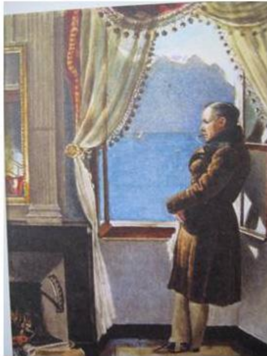
В. А. Жуковский