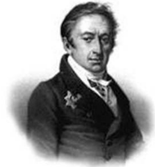
Н. М. Карамзин