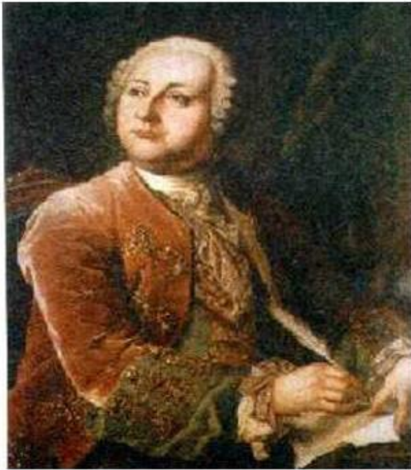
М. В. Ломоносов

Самыми яркими авторами русского сентиментализма считаются Муравьев, Дмитриев, Карамзин, Жуковский и Радищев.