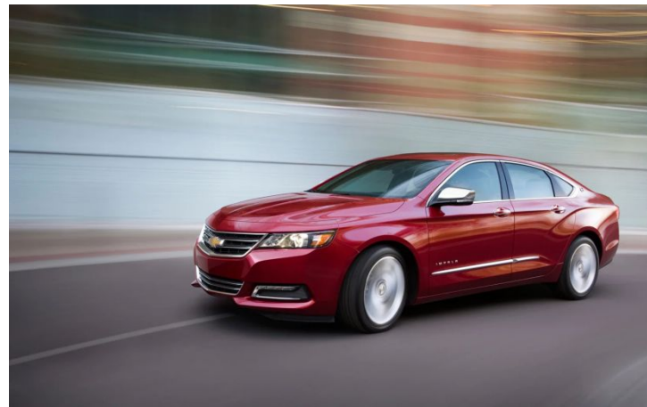
В. Шевроле Импала