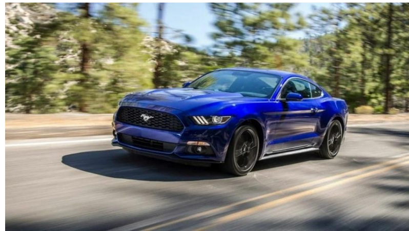
А. Форд Мустанг