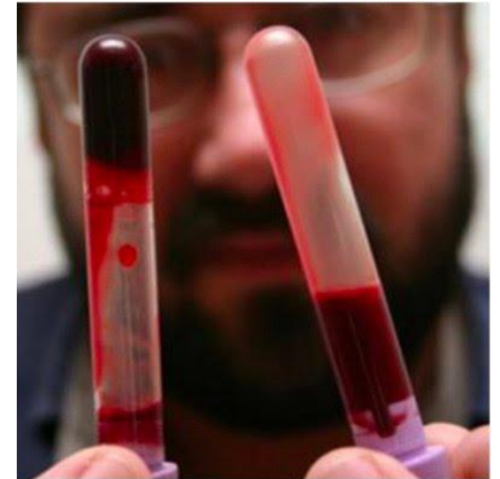
С. Сгусток крови