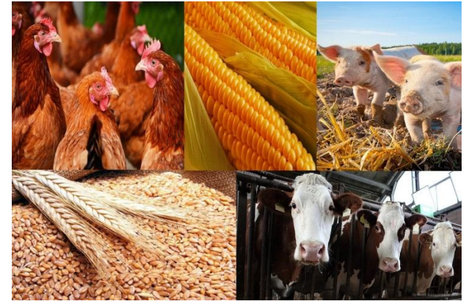
С. Сельскохозяйственное предприятие