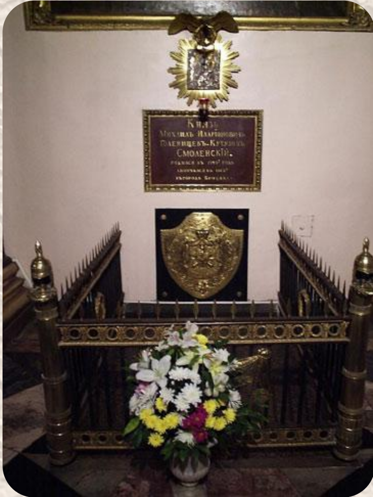
Могила М. И. Кутузова в Казанском соборе в Санкт-Петербурге