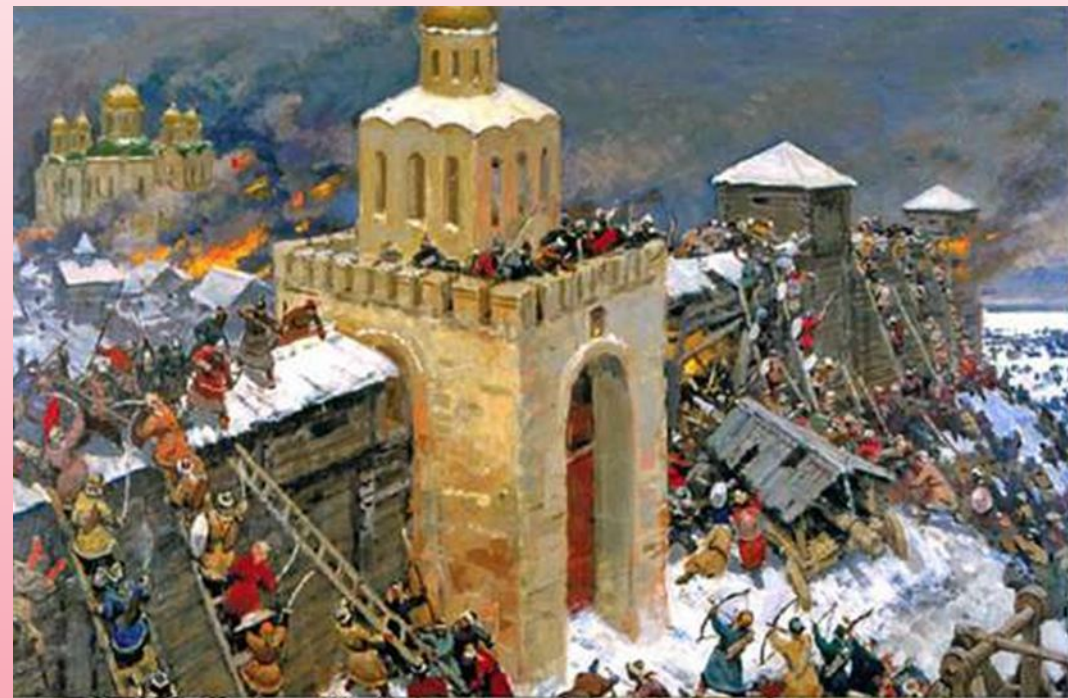
Использование осадной техники татарами в захвате Владимира

Коломна, Москва, Владимир и др. города сожжены, жители перебиты. Остатки русского войска собираются под знамена Юрия Всеволодовича, владимирского князя, но на реке Сити, были разгромлены в 1238 г. Батый идет на Новгород через Торжок, надеясь пополнить запасы зерна и фуража. Но жители оказывают упорное сопротивление (наморозили ледяной панцирь на стенах, чтобы скользили штурмовые лестницы и нельзя было поджечь). Через 2 недели город пал. Но жители успели сжечь все зерно, чтобы не досталось врагу.