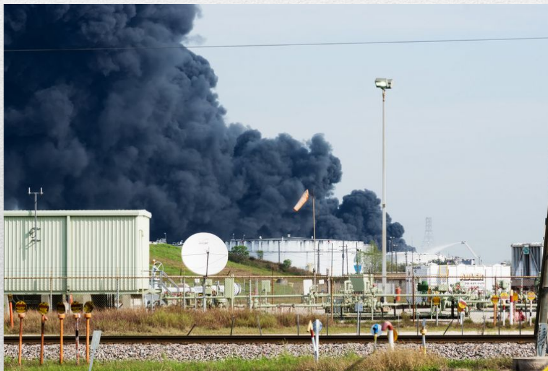
Взрыв на химическом заводе.