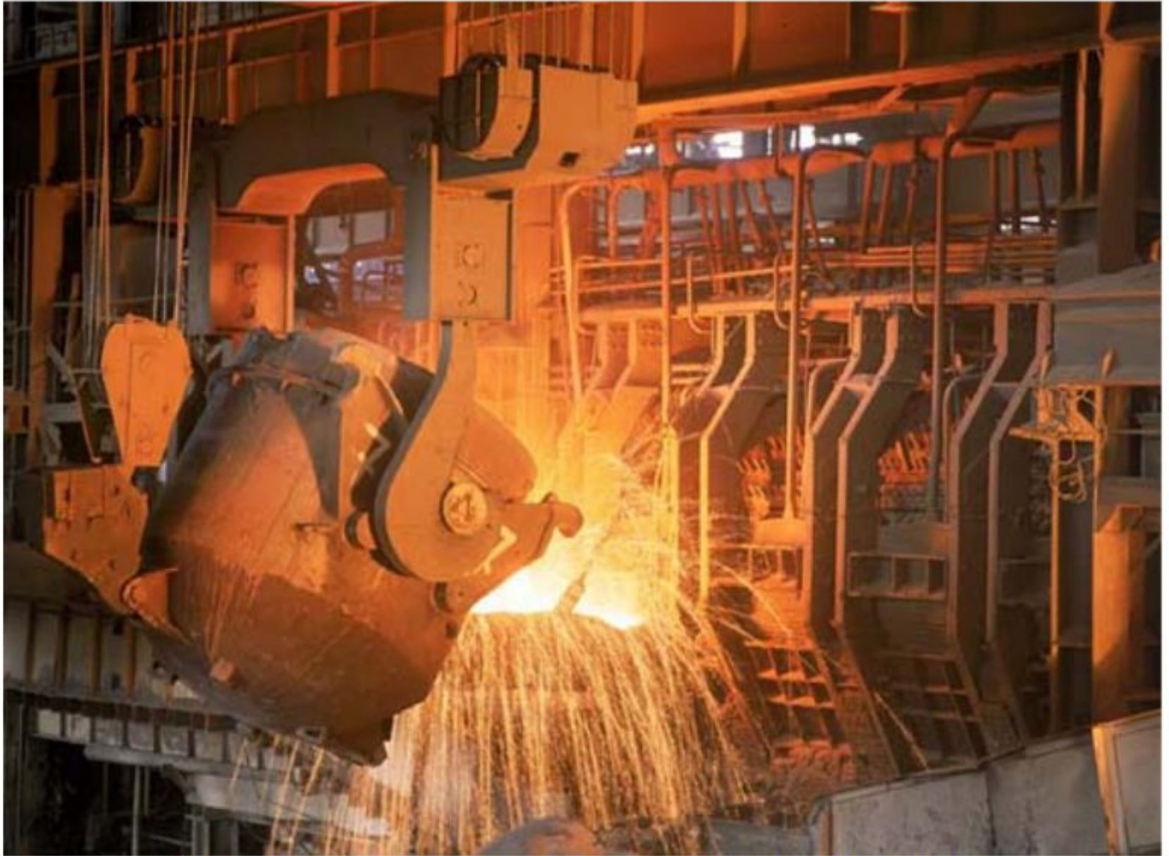
Заливка чугуна в мартеновскую печь