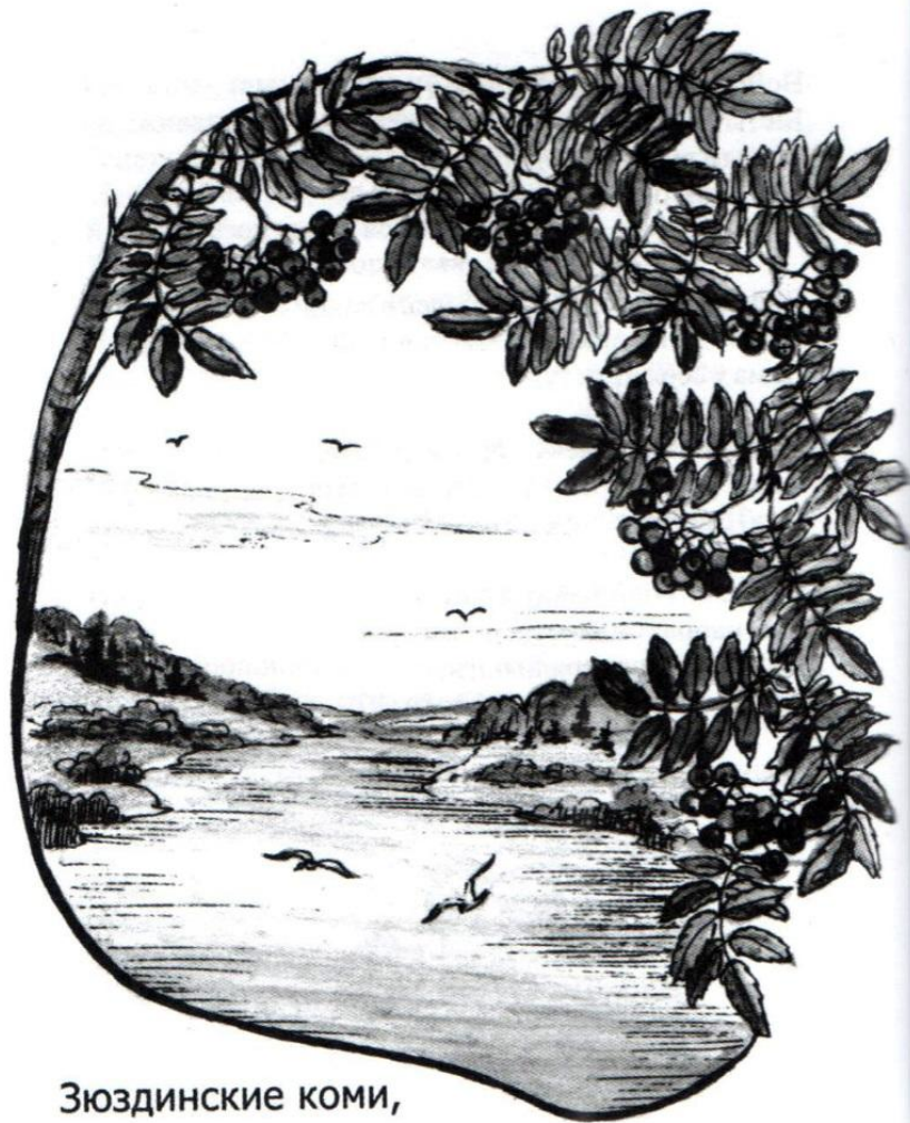
Зюздинские коми, зюздинские пермяки