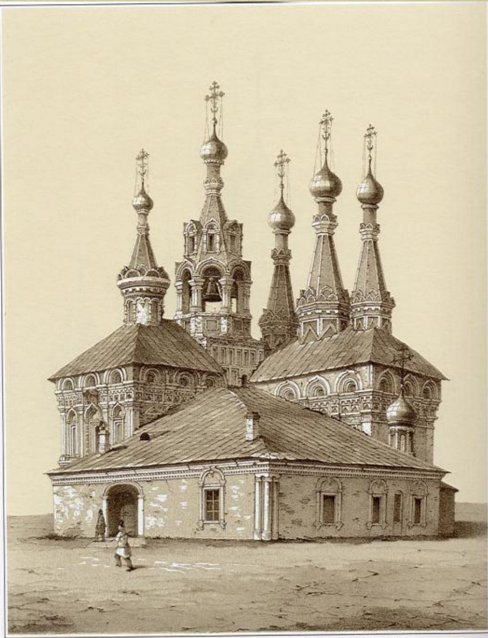
ЦЕРКОВЬ РОЖДЕСТВА БОГОРОДИЦЫ В ПУТИНКАХ В МОСКВЕ