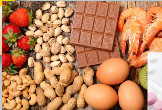
употребление в пищу некоторых продуктов