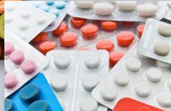
индивидуальная непереносимость лекарственных средств и т.п.