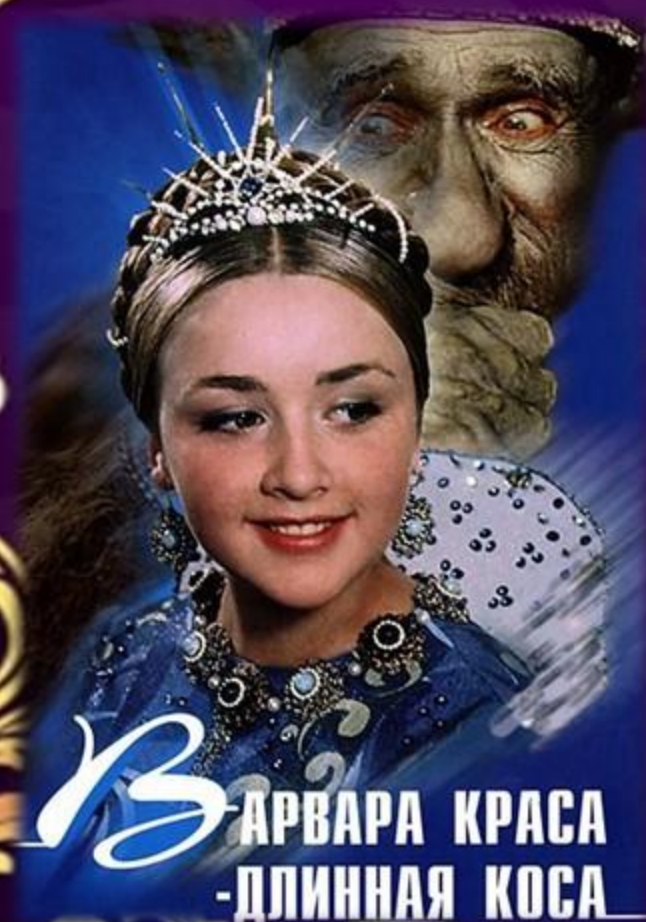
ВАРВАРА КРАСА -ДЛИННАЯ КОСА

Премьера фильма состоялась 30 декабря 1970 года