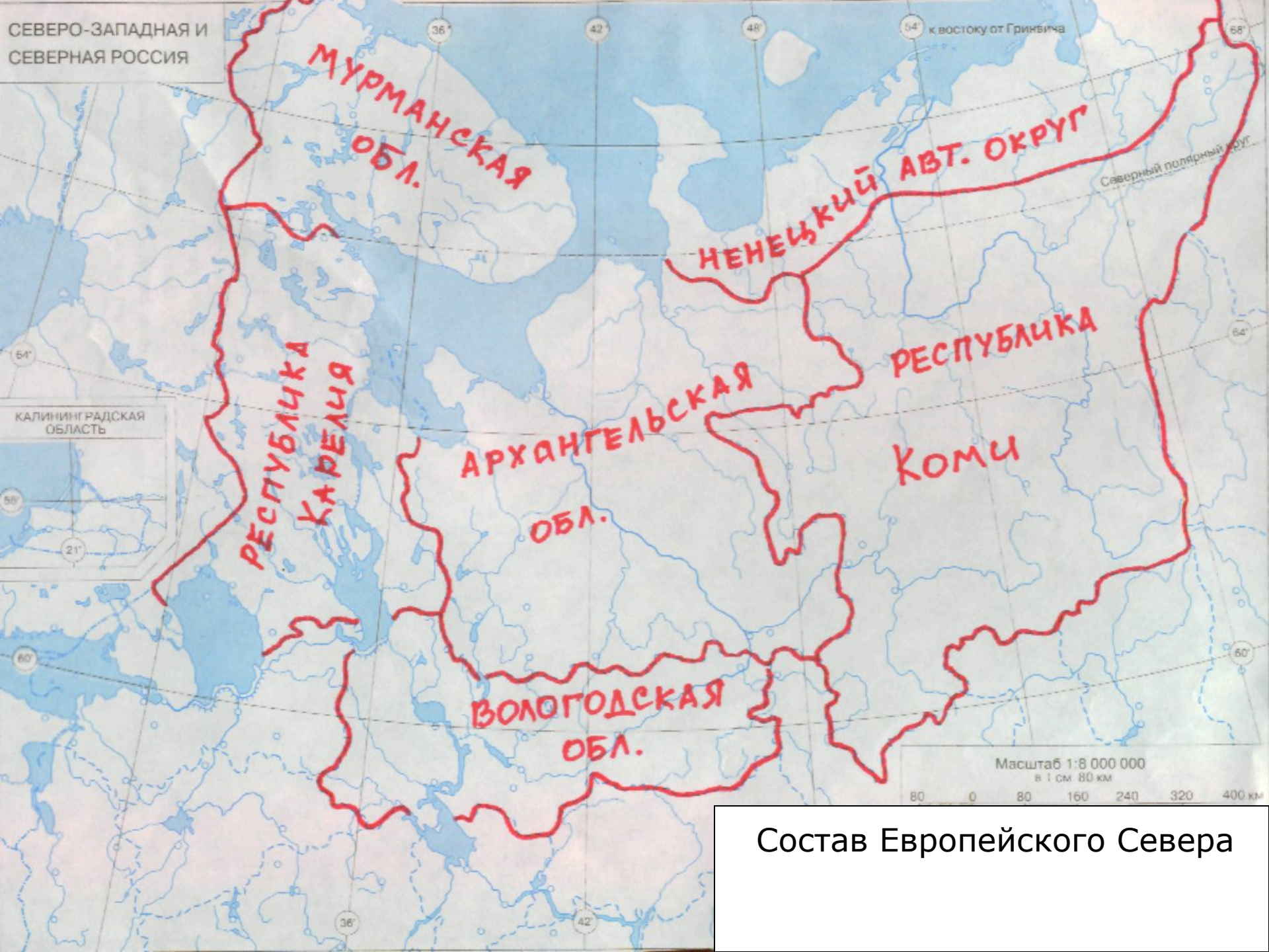
Состав Европейского Севера