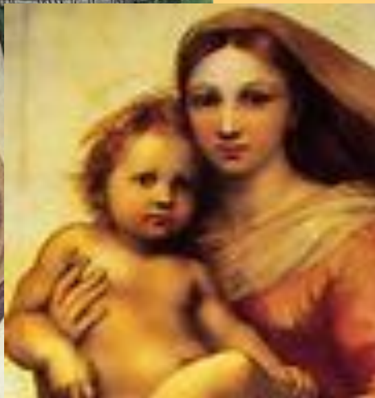
Рафаэль Санти Сикстинская Мадонна 1513-1514 Дрезден