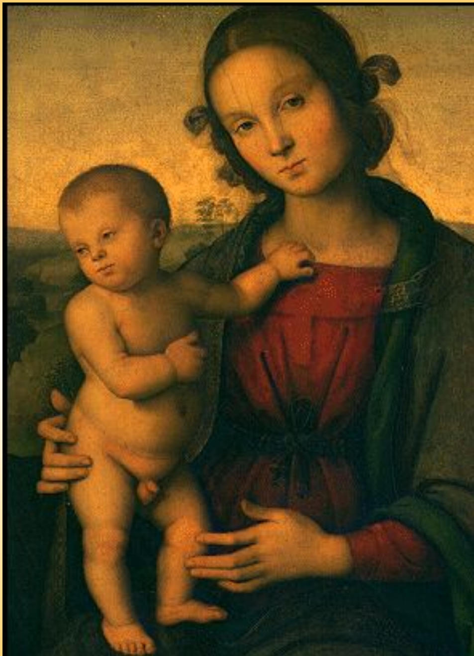
П. Перуджино «Мадонна с младенцем»