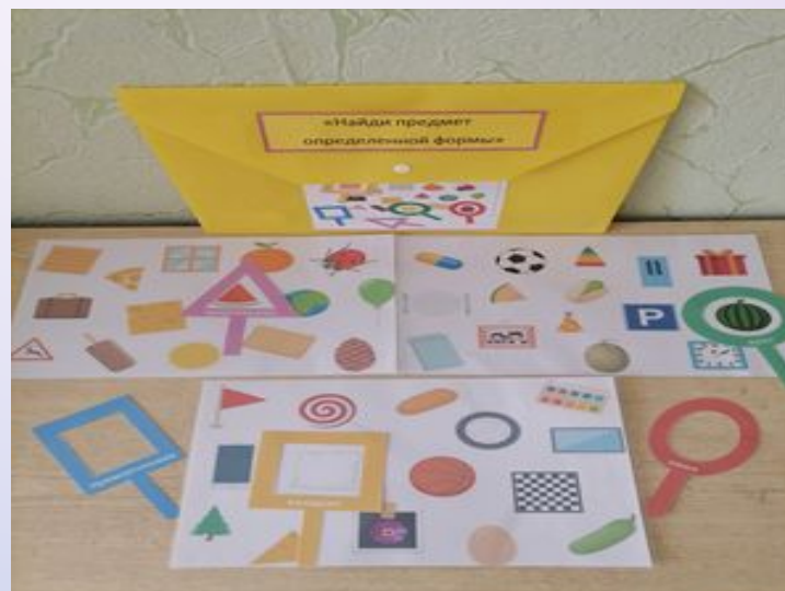
«Найди предмет определенной формы»