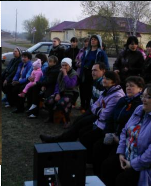
Вечер военной песни