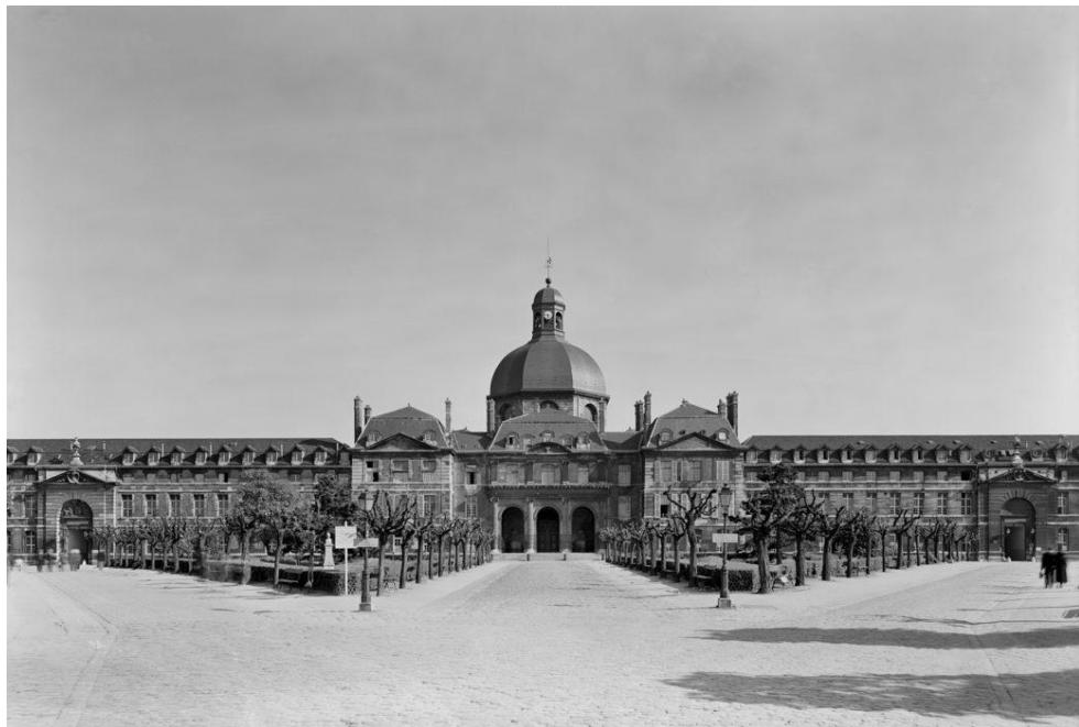
Психиатрическая клиника Франции в Сальпетриере