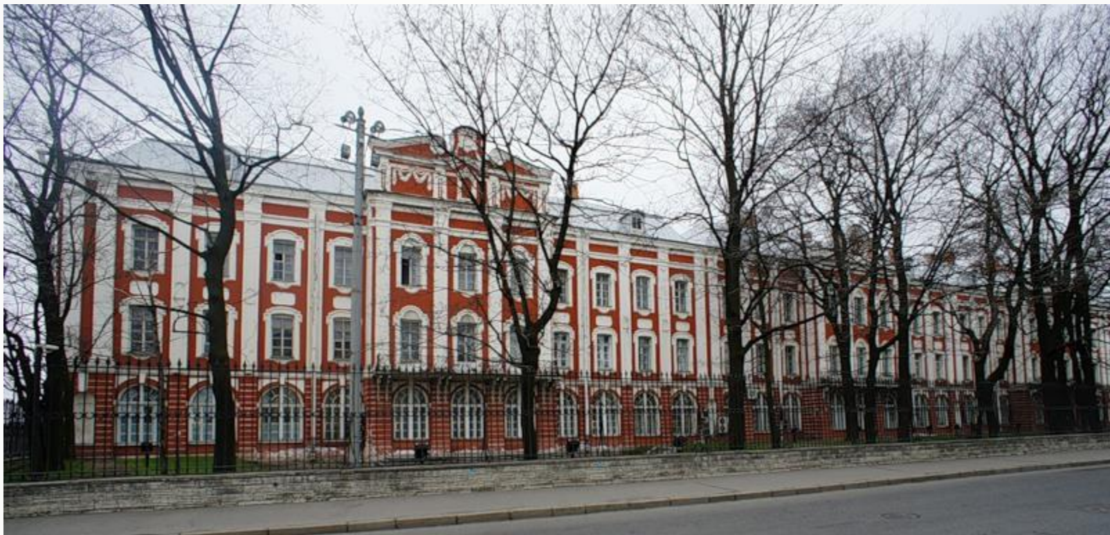
Здание двенадцати коллегий