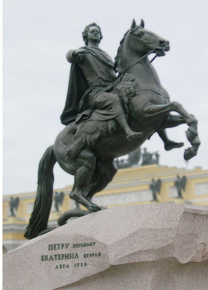
Памятник Петру I