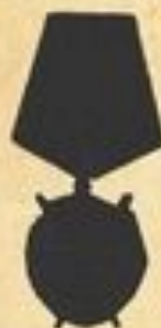
Орден Боевого Красного знамени