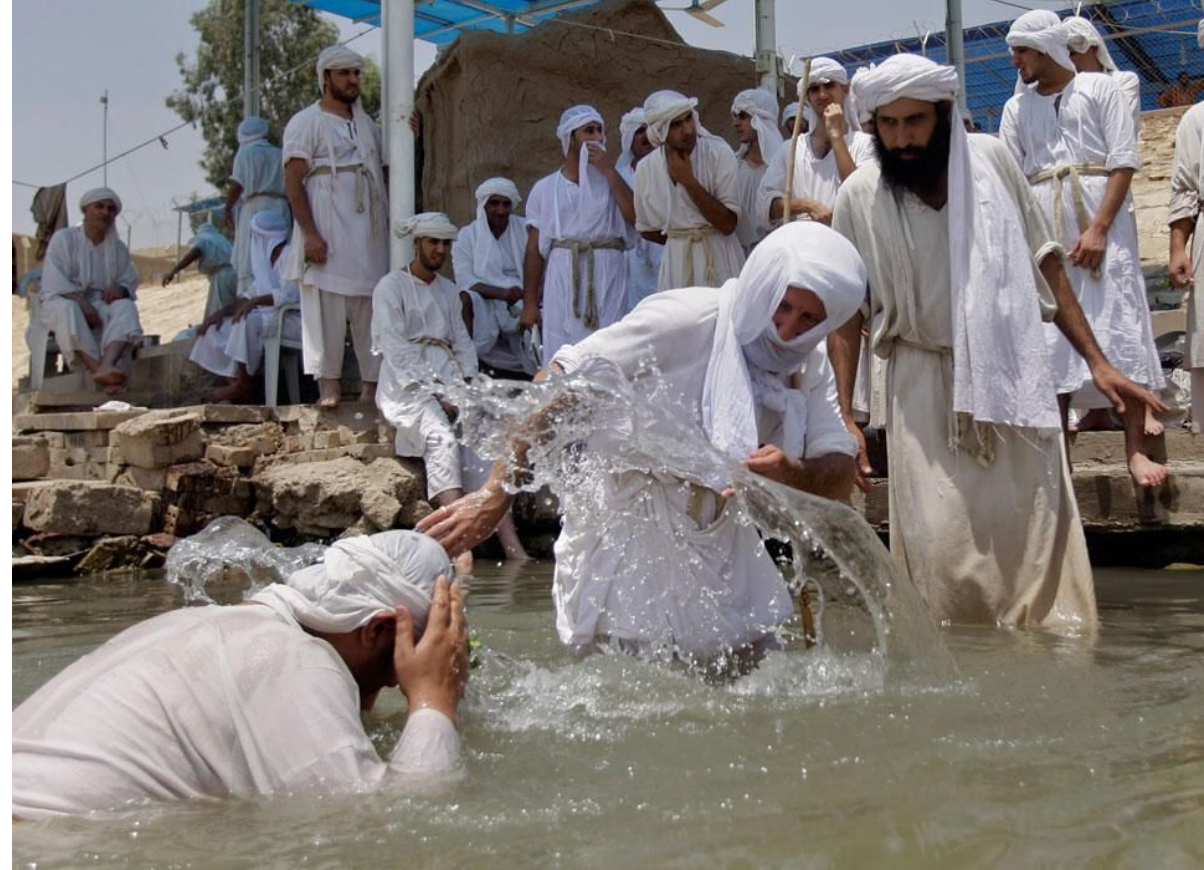
Водное крещение учеников Иоанна