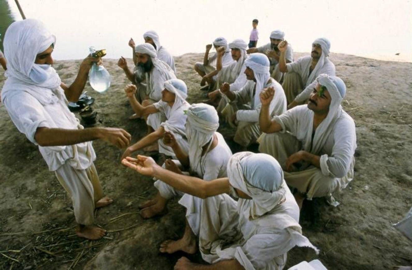
Печальная судьба "Учеников Иоанна"