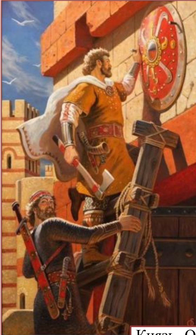
Князь Олег, 911 г.