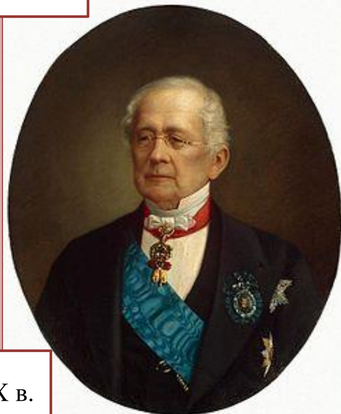
А.М.Горчаков, дипломат XIX в.