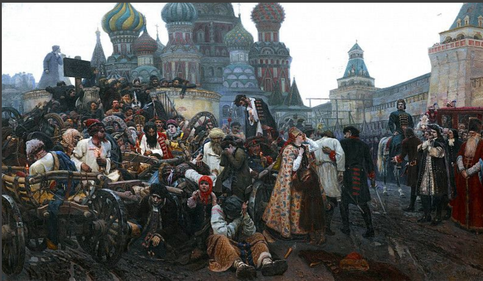
Василий Иванович Суриков – Утро стрелецкой казни 1881.