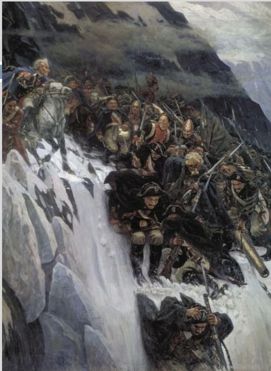
Василий Иванович Суриков – Переход Суворова через Альпы в 1799 году. 1899