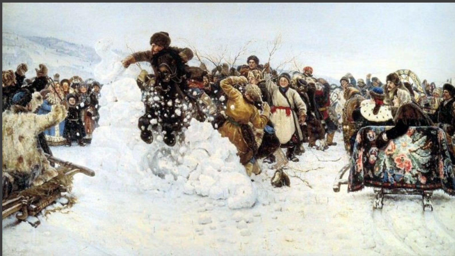
Василий Иванович Суриков – Взятие снежного городка. 1891