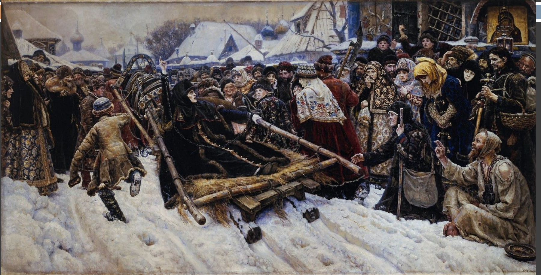
Василий Иванович Суриков – Боярыня Морозова. 1887