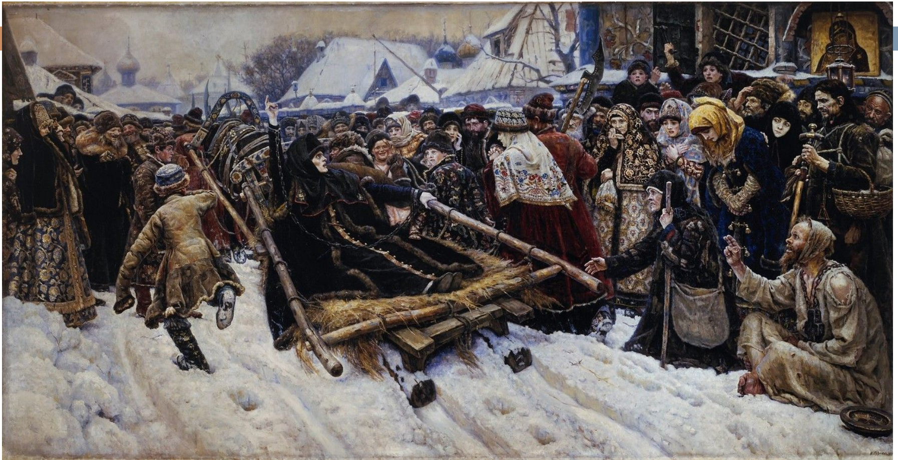
Василий Иванович Суриков – Боярыня Морозова. 1887