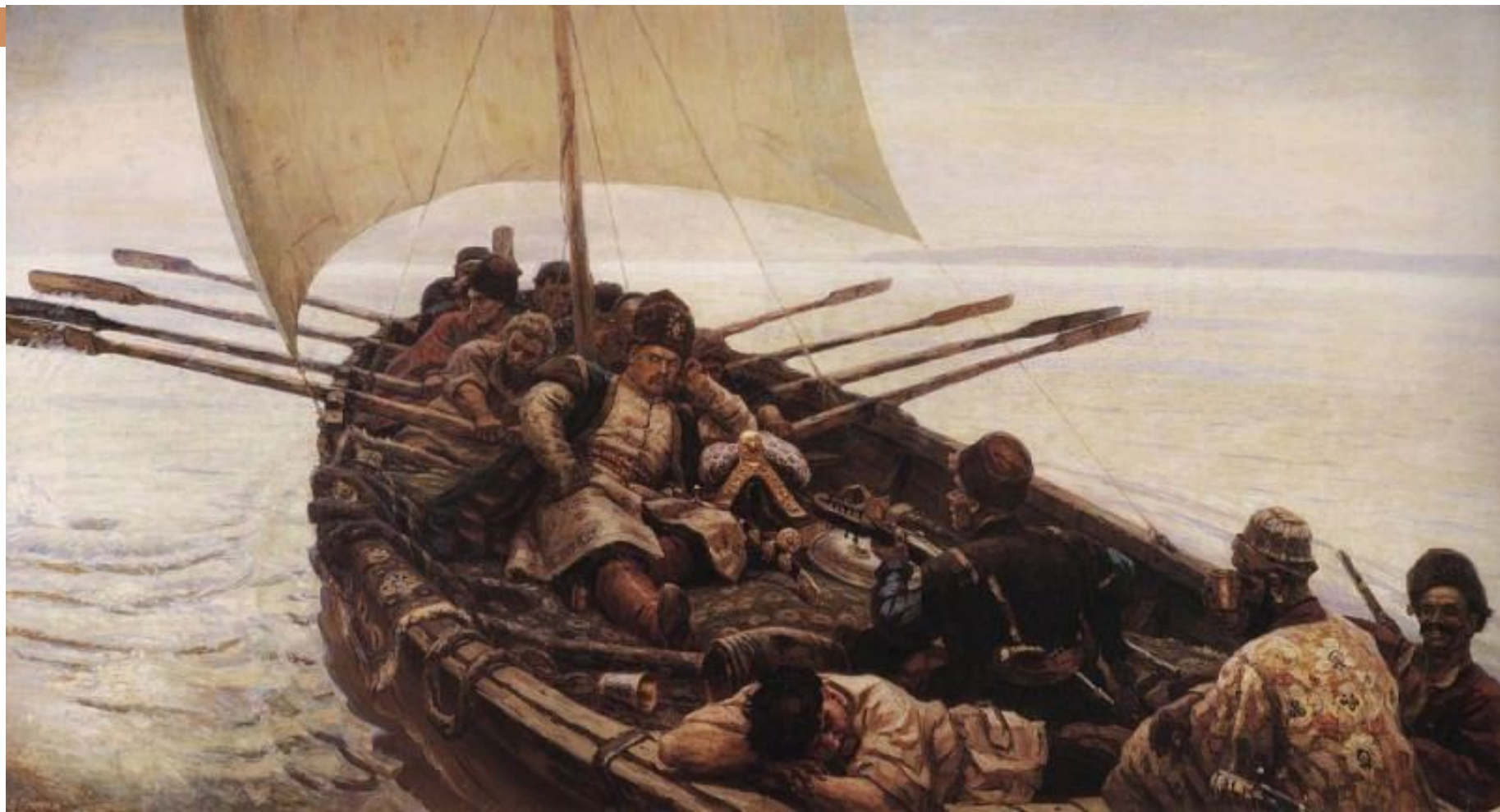
Василий Иванович Суриков – Степан Разин. 1906