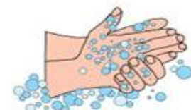
мойте руки не менее 15 секунд