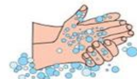
мойте руки не менее 15 секунд