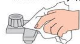
вытрите кран после себя