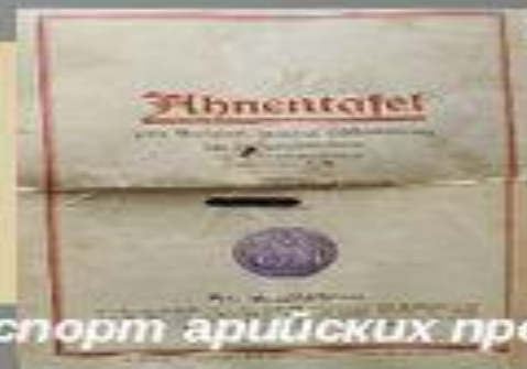
Паспорт арийских предков

Совокупность учений о физической и психической неравноценности рас