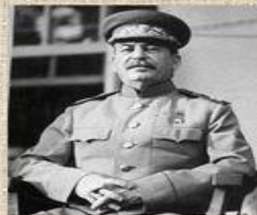
Сталин (СССР) вождь