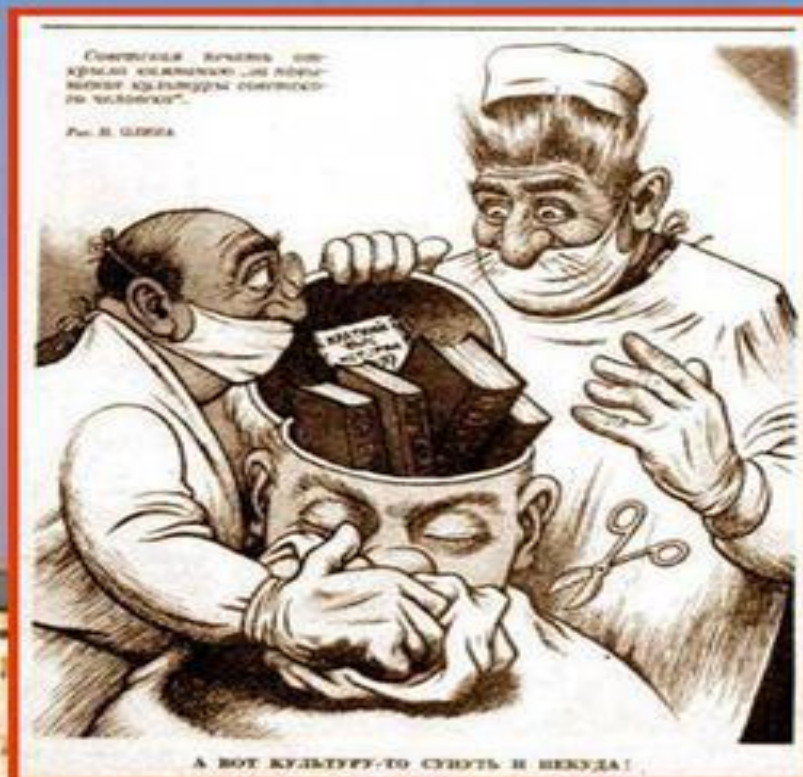
Карикатура на цензуру.

В стране существовала цензура . Многие литературные произведения, театральные постановки и художественные фильмы объявлялись запрещёнными. СМИ предоставляли информацию, выгодную правящему режиму.