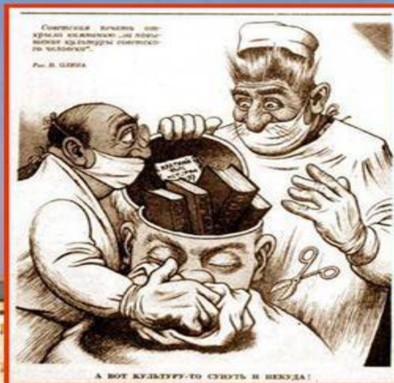
Карикатура на цензуру.

В стране существовала цензура . Многие литературные произведения, театральные постановки и художественные фильмы объявлялись запрещёнными. СМИ предоставляли информацию, выгодную правящему режиму.