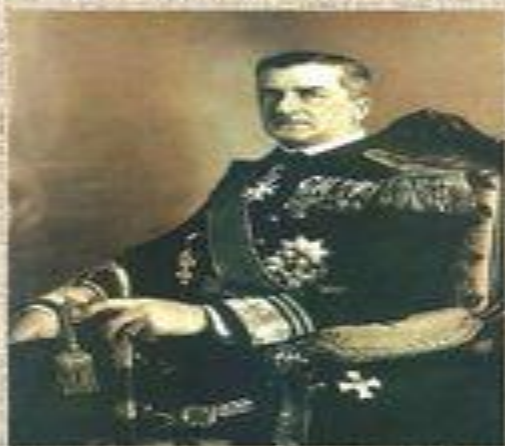
Хорти, регент (Венгрия)