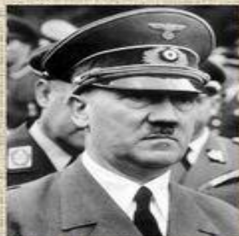
Гитлер (Германия) фюрер