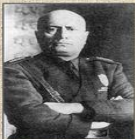
Муссолини (Италия) дуче