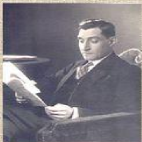
Салазар, диктатор (Португалия)