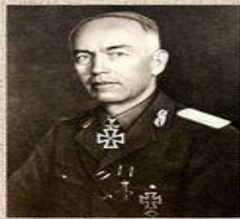
Антонеску (Румыния) кондукэтор