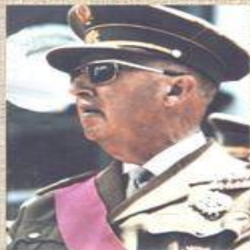
Франко (Испания) каудильо