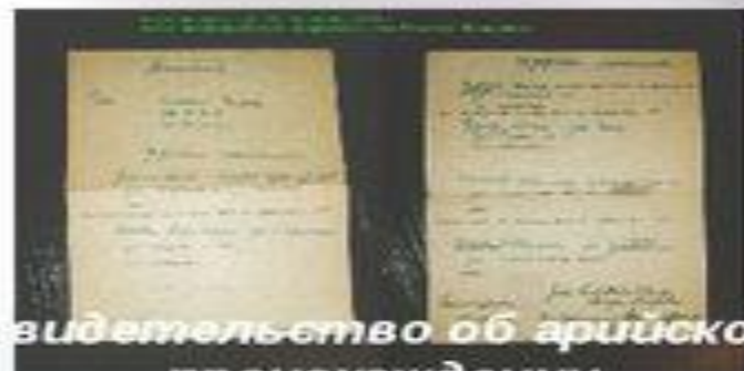
Свидетельство об арийском происхождении