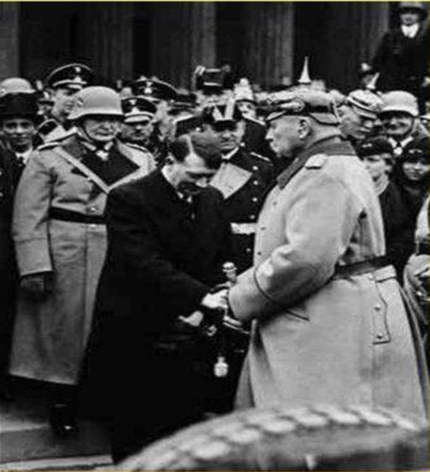
Президент Германии Гинденбург поздравляет А. Гитлера с назначением

30 января 1933 г. А. Гитлер был назначен канцлером Германии. В течение года Германия превратилась в однопартийное тоталитарное государство.