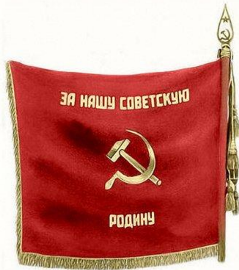
Знамя 41 Нахичеванского погранотряда