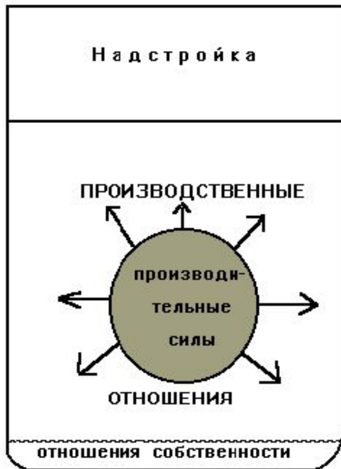
Рис.2.3. Схема марксистской модели способа производства