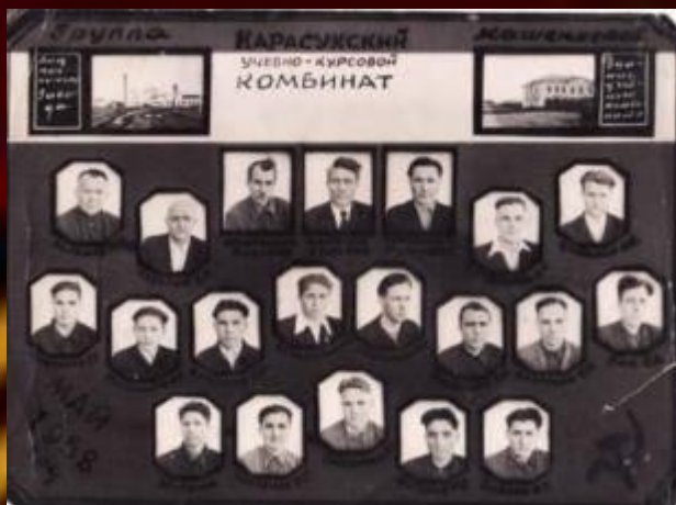
Выпускная группа (второй ряд справа)