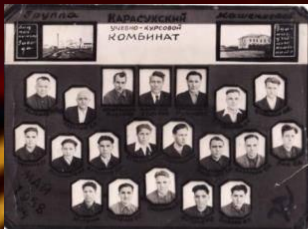
Выпускная группа (второй ряд справа)