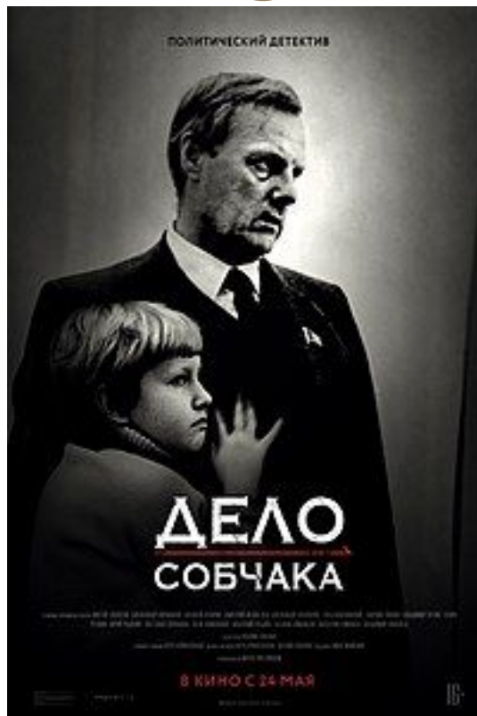
Фильм «Дело Собчака», посвященный жизни и карьере А. А. Собчака.