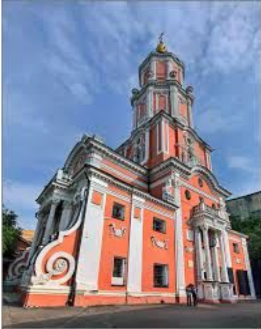
Церковь Архангела Гавриила на Чистых прудах (Меншикова башня)