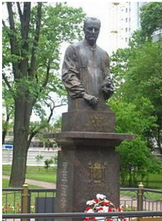
Памятник в Санкт-Петербурге