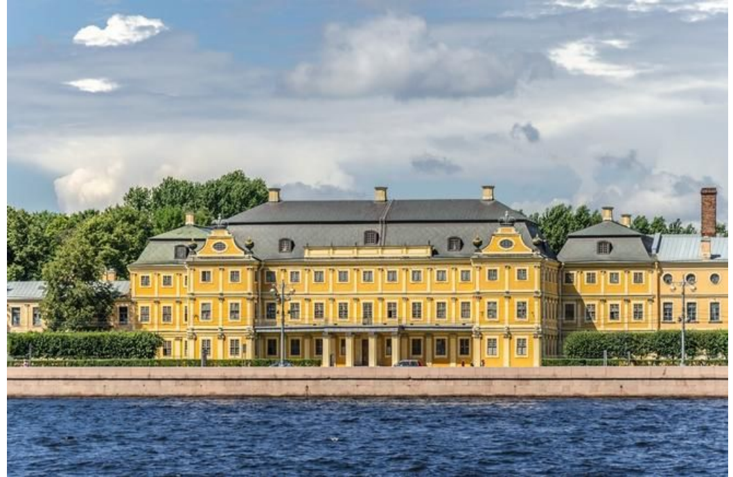
Меншиковский дворец в Санкт-Петербурге